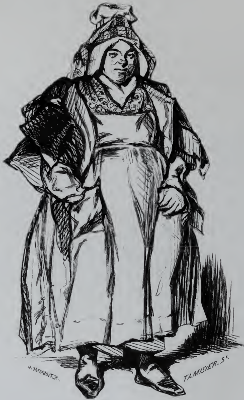
La Marchande de la Halle.